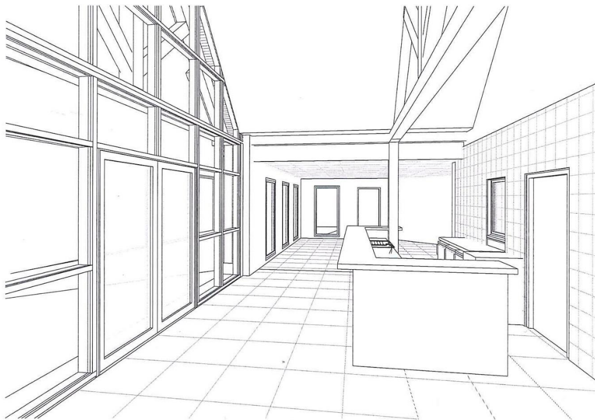
Perspective intérieure du bâtiment